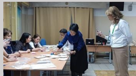
Фото: подсчет голосов